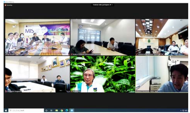
マヒドン大学シリラ病院の様子。 撮影場所：九州大学病院