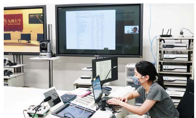
アメリカから参加の医師。 撮影場所：九州大学病院