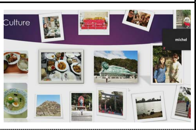
提示されたスライド。