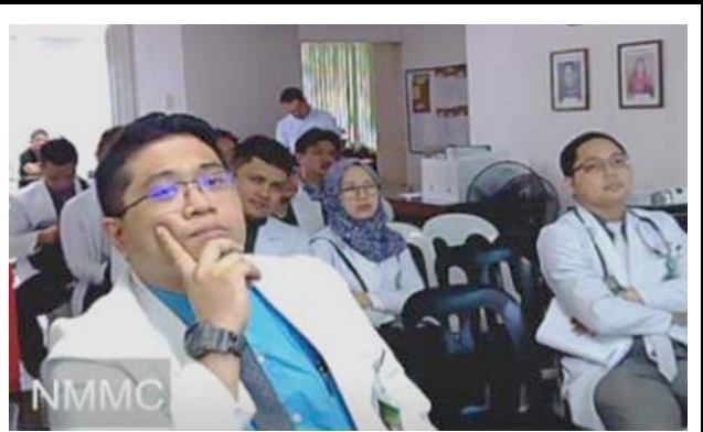
モニタに表示される接続施設。