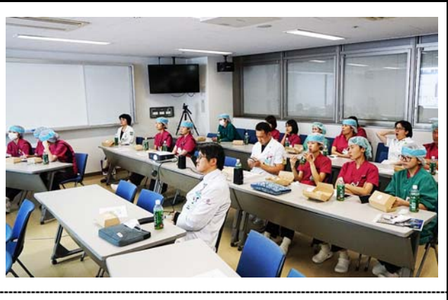
リアルタイムで画面に質問が表示される様子。 撮影場所：九州大学病院