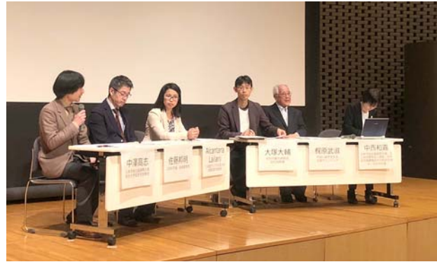
別府国際コンベンションセンターの様子。 撮影場所：別府国際コンベンションセンター