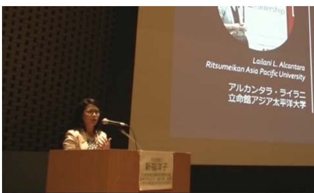
提示されたスライド。 撮影場所：九州大学病院