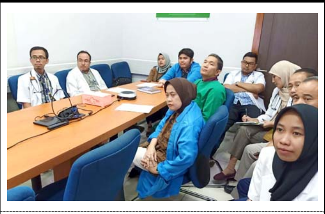
九州大学病院の様子。 撮影場所：九州大学病院