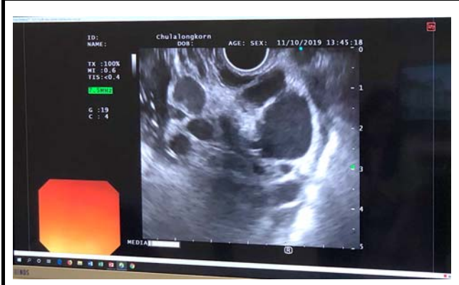
チュラロンコン大学の様子。 撮影場所：チュラロンコン大学