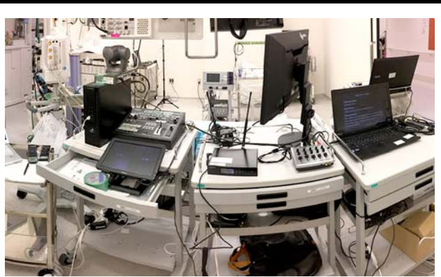
ライブ手術の様子。 撮影場所：大阪国際がんセンター