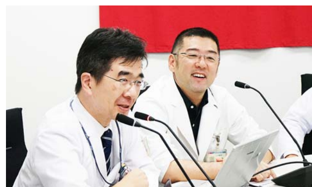
九州大学病院の様子。 撮影場所：九州大学病院