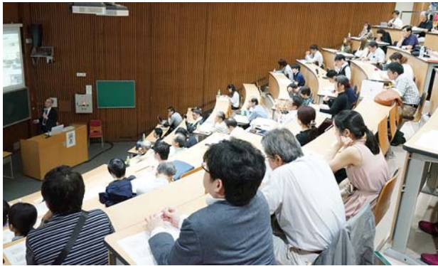
九州大学病院の様子。