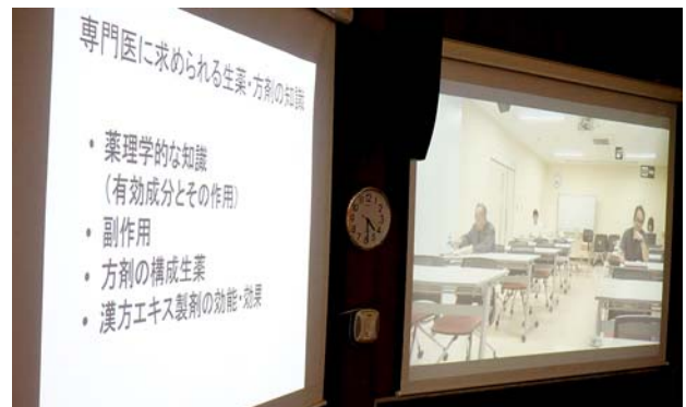
提示されたスライドと接続施設。