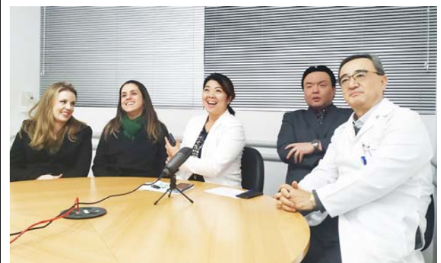
ブラジル 杉沢総合病院の様子。