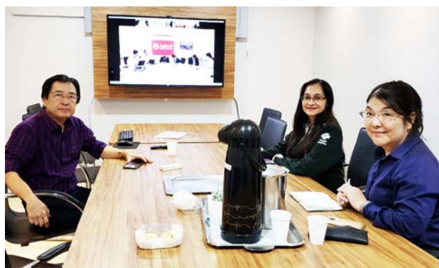
アマゾン病院の様子。