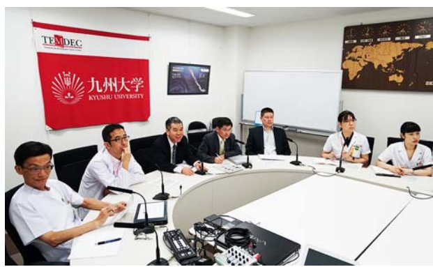
九州大学病院の様子。

【概要】 本テレカンファレンスは、九州大学病院で「本当の和食」について研修したブラジルの栄養士6名が、帰国後にどのように活動し実践しているかを確認するために実施された。施設の食事をより美味しく提供する上で発生する課題に対して検証を行い、より美味しい和食の提供に繋げていくための討議を行うことができた。