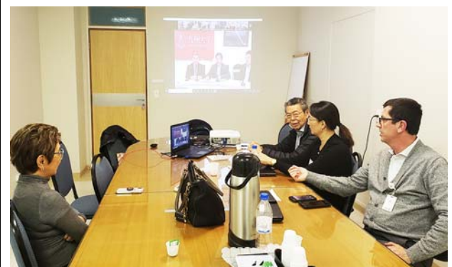
ノボ・アチバイア病院の様子。