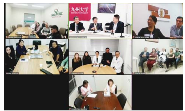
モニタに映し出される接続施設。