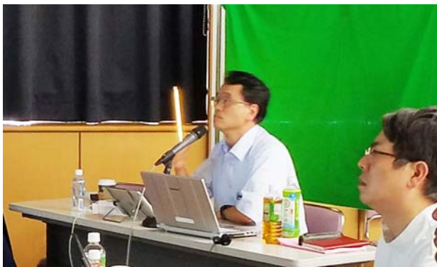
撮影場所：大阪母子医療センター