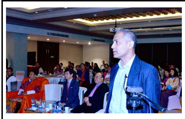
コメントする参加者。 撮影場所：DrukREN