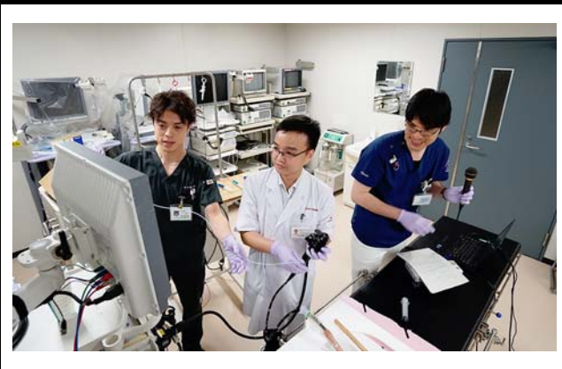
九州大学病院の様子。 撮影場所：九州大学病院