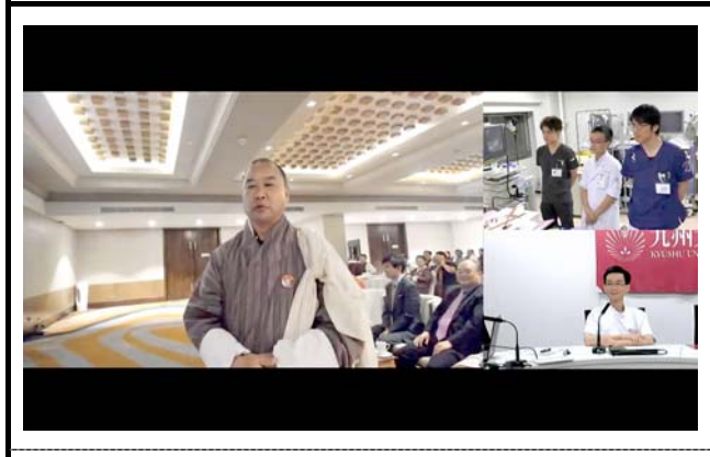
モニタに表示される接続施設。 撮影場所：九州大学病院