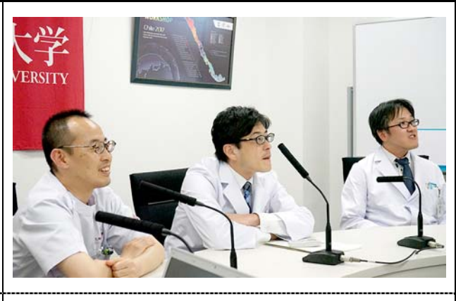
九州大学病院の様子。