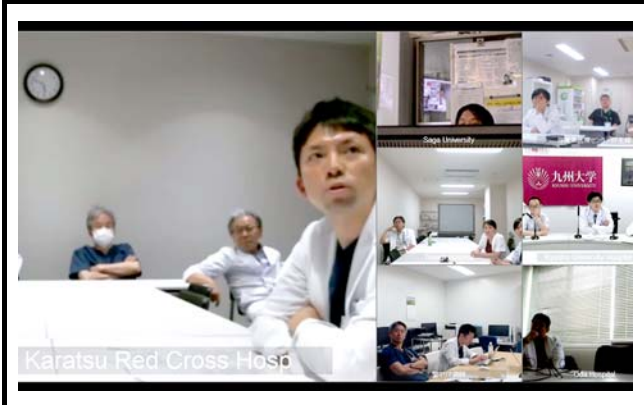
モニタに表示される接続施設。