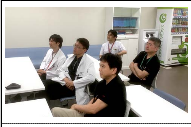
佐賀県医療センター好生館の様子。