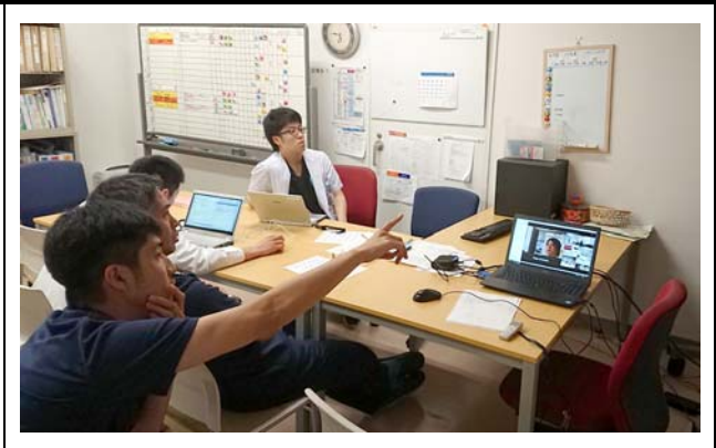
久留米聖マリア病院の様子。