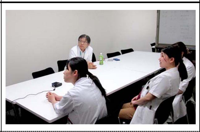
高邦会高木病院の様子。