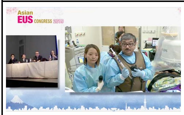
モニタに表示される接続施設。 撮影場所：九州大学病院