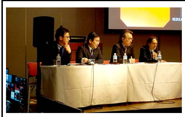
メイン会場の座長。 撮影場所：砂防会館