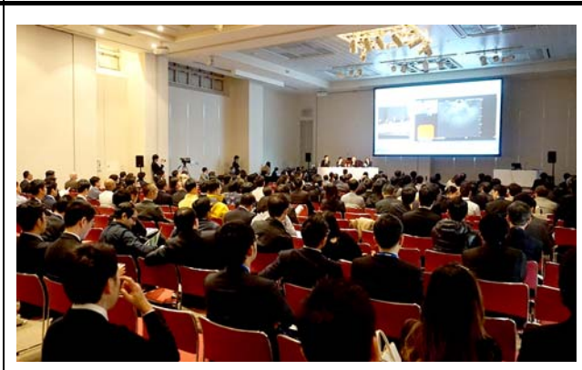
砂防会館の様子。 撮影場所：砂防会館