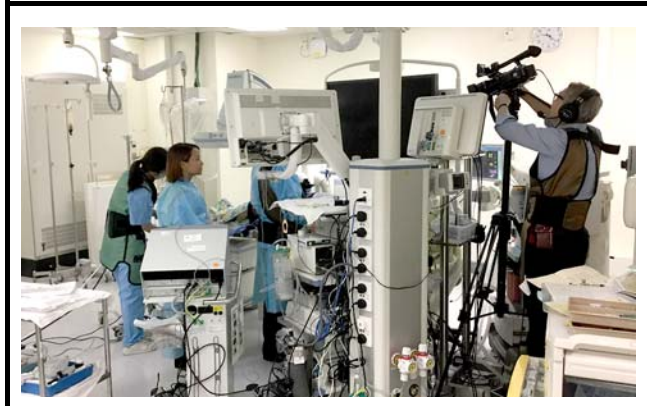
バックヤードで働く技術スタッフ。 撮影場所：香港中文大学プリンスオブウェールズ病院