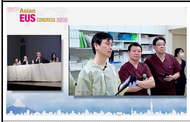
モニタに表示される接続施設。