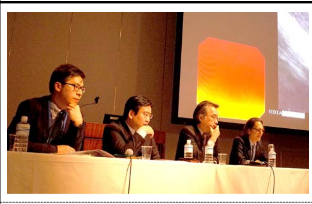
メイン会場の座長。