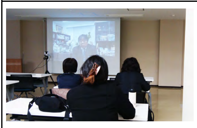
北海道大学の様子。 撮影場所：北海道大学