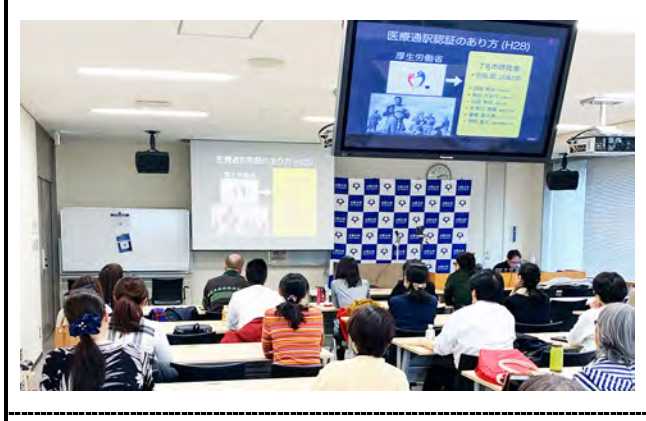
大阪大学の様子。 撮影場所：大阪大学