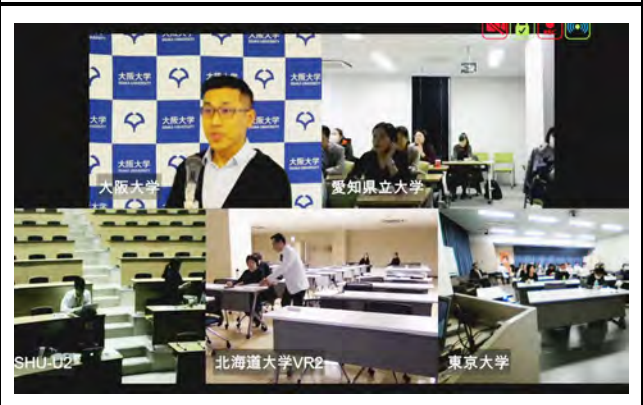
モニタに映し出される接続施設。 撮影場所：九州大学病院