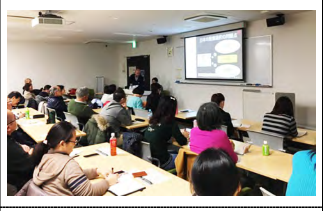
愛知県立大学の様子。 撮影場所：愛知県立大学