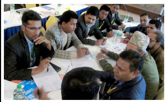
ワークショップの様子。 撮影場所：イエロー パゴダ ホテル