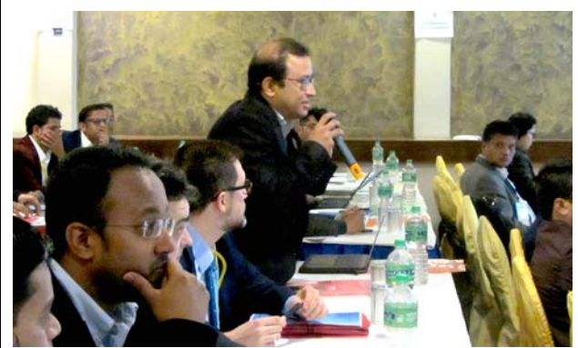
コメントする参加者。 撮影場所：イエロー パゴダ ホテル