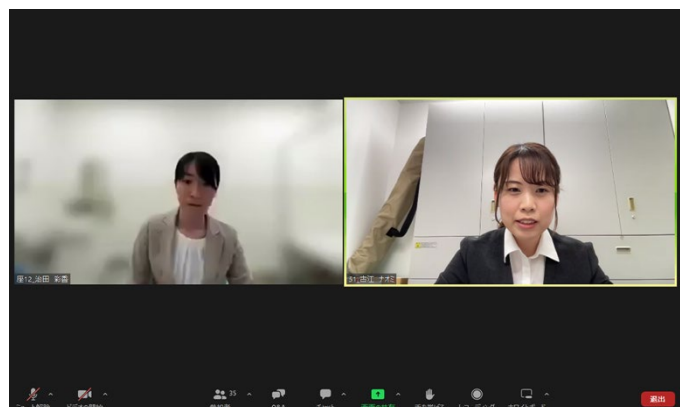
Monitor shows connected site. Picture taken at: Kyushu University Hospital