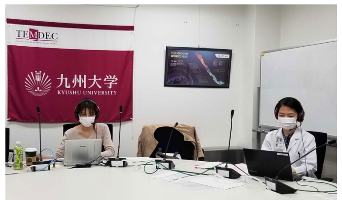
Teleconference view at Kyushu University Hospital. Picture taken at: Kyushu University Hospital