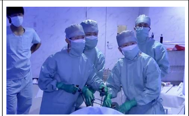
提示された動画。 撮影場所：九州大学病院