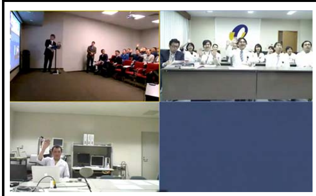
モニタに表示される接続施設。 撮影場所：九州大学病院