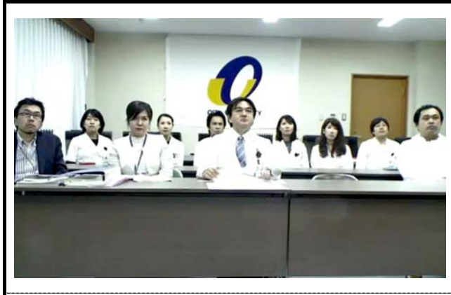
大分大学の様子。 撮影場所：九州大学病院