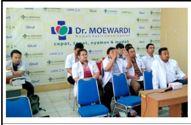
セバラス・マレット大学 ムワルディ病院の様子。