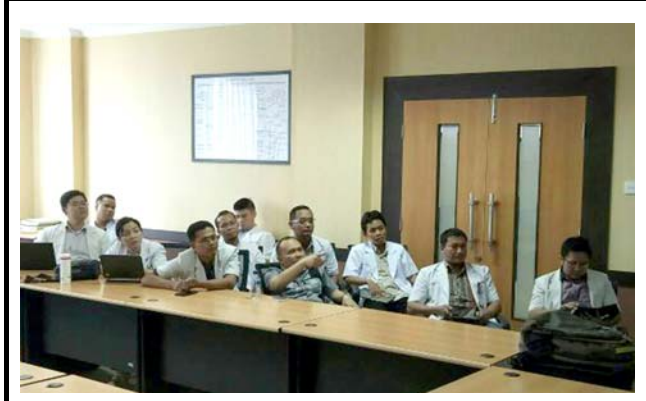
ハサヌディン大学の様子。