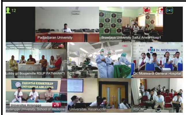
モニターに表示される接続施設。