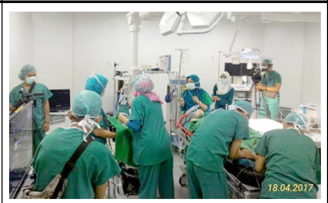
ファトマワティ病院の様子。