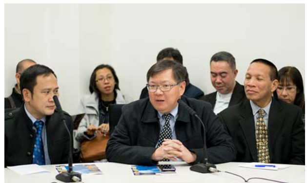
コメントする参加者 (中央)。