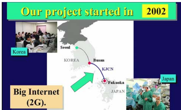
提示されたスライド。