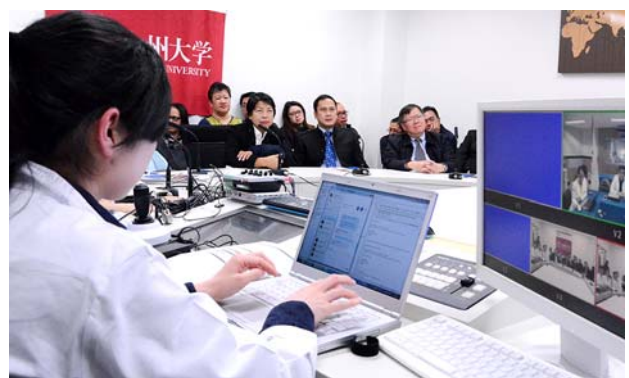
接続を調整するエンジニア。