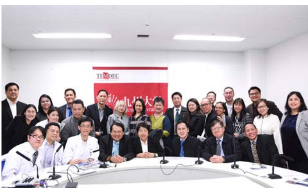
九州大学病院でのグループ写真。