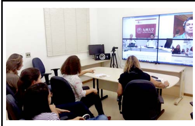
ブラジル癌研究所での会場の様子。 撮影場所：ブラジル癌研究所