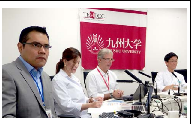
九州大学病院での会場の様子。 撮影場所：九州大学病院