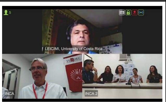
モニタに映し出される3地点の様子。 撮影場所：九州大学病院