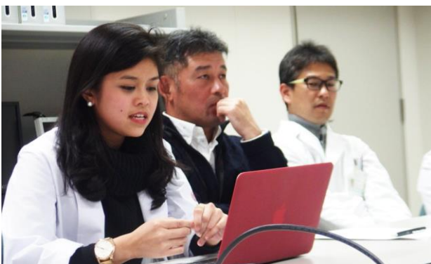
提示されたスライド。 撮影場所：九州大学病院