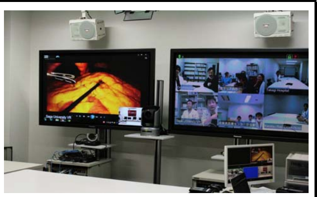
各会場と手術映像を映したモニタ。