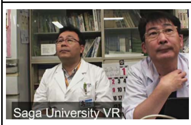
佐賀大学での会場の様子。