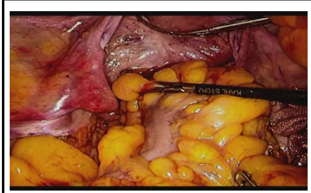
提示された手術動画。