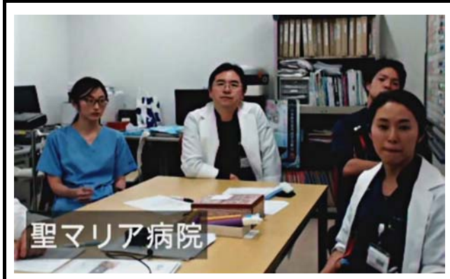
久留米聖マリア病院での会場の様子。