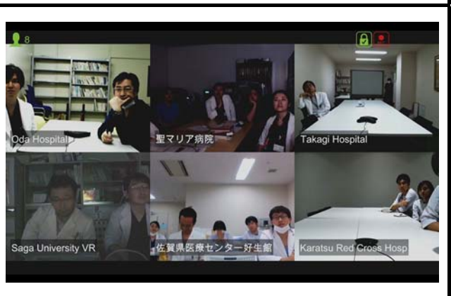
モニタに映し出される6地点の様子。