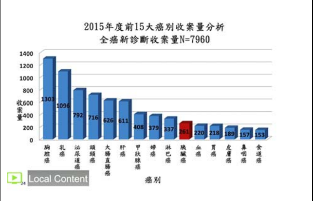
提示されたスライド。 撮影場所：九州大学病院