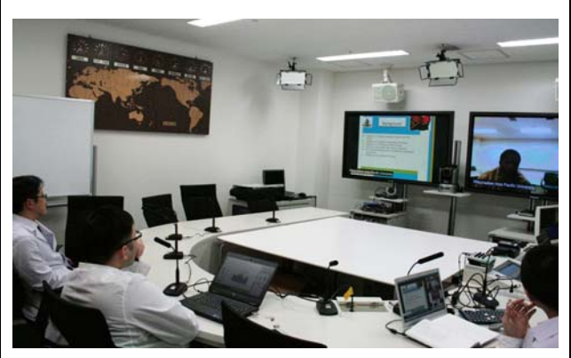
接続された 2 地点の様子。 撮影場所：九州大学病院