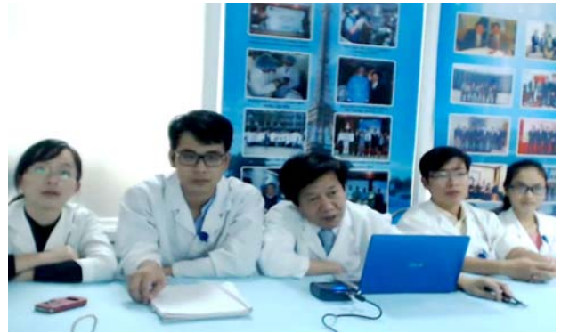
JW マリオットホテル ハノイの会場の様子。 撮影場所：JW マリオットホテル ハノイ