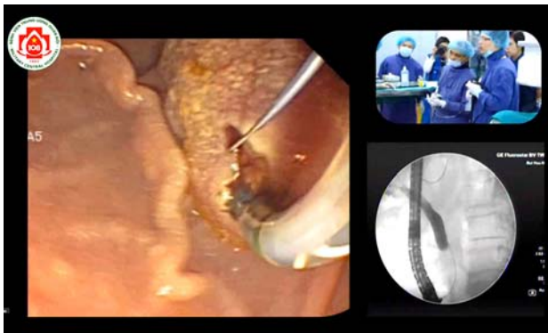
フェ大学病院の様子。 撮影場所：フェ大学病院