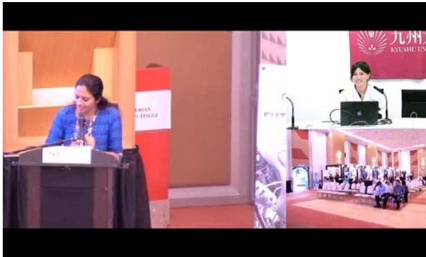
モニタに表示される接続地点。