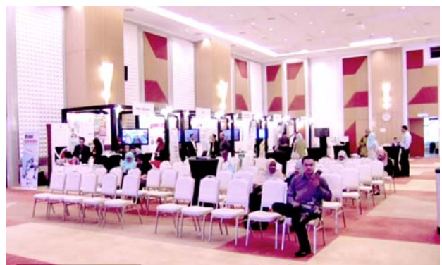
マレーシア高等教育省の様子。