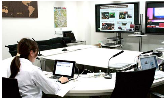
九州大学病院の様子。