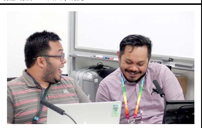
九州大学病院の様子。 撮影場所：九州大学病院